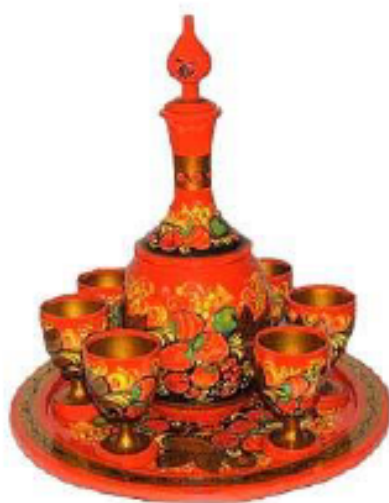
В.Удалова Набор "Золотой орнамент" 2003