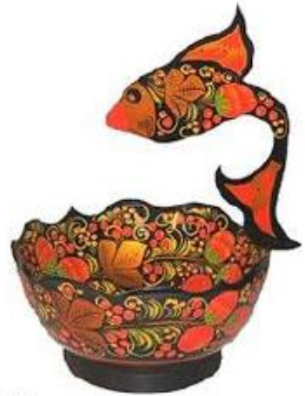
В.Цветкова. Чаша "Золотая рыбка" 2000

- Как волшебница жар-птица Не выходит из ума Чародейка-чаровница, Золотая Хохлома.