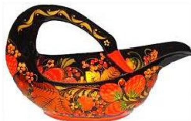
Е.Оленина Ковш. 2003

Ох, Россия, ты, Россия, В каждом граде терема Всей земле на удивленьe Золотая Хохлома!