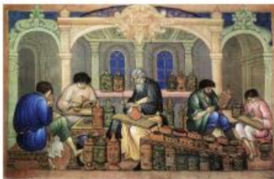
И. М. Баканов. Хохломские художники за работой. Палех, 1929 год

Вот, посмотрите! Выросла золотая травка на ложке, Распустился цветок на плошке, Ягодка клюква поспела на поварешке. Клюет эту ягоду птица – золотое крыло