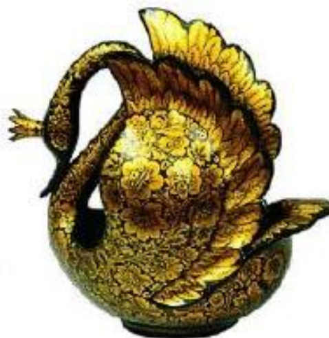
Т.Белянцева Ковши-братина "Черный лебедь" 1995