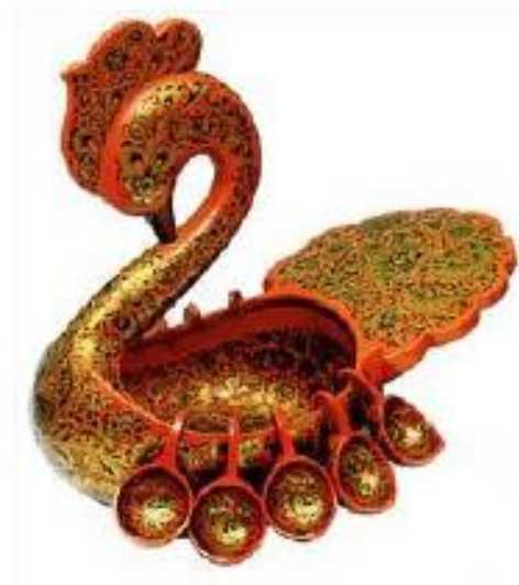
Т.Белянцева Братина с шестью ковшами. 1980

Найдите слова, соответствующие теме урока